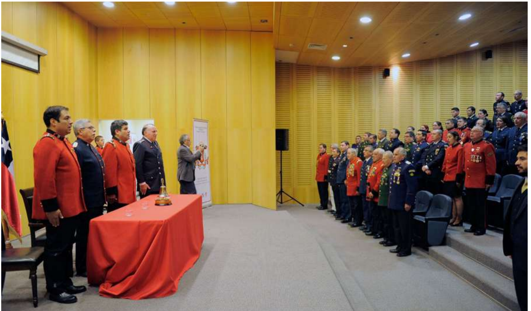
Este nuevo aniversario, que celebraron con una Sesión Solemne en el auditorio del Hospital Higuera de Talcahuano, se vivió de manera especial e inmersos en interesantes desafíos.

Es la unidad más antigua del puerto, la tercera más antigua de la Región del Biobío, y una de las 20 primeras en fundarse en el país. Lleva el nombre del primer capitán y uno de sus principales líderes hasta su muerte en 1892, Eduardo Cornou Chabri.