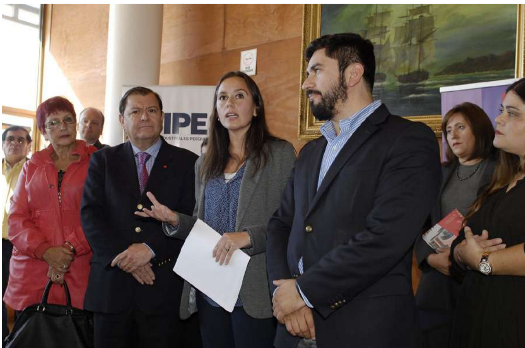
Durante el lanzamiento, realizado en el restaurant - bentoteca Miramar, ceremonia a la que asistieron autoridades regionales, comunales, representantes de las empresas socias y de Inacap.

El plan cuenta con el apoyo técnico de Inacap y entre sus objetivos está el incorporar el jurel y la jibia en la carta de productos de los restaurantes del piloto, para lo cual se desarrollan cursos de capacitación para el mejoramiento de su despliegue gastronómico, de gestión y servicio.