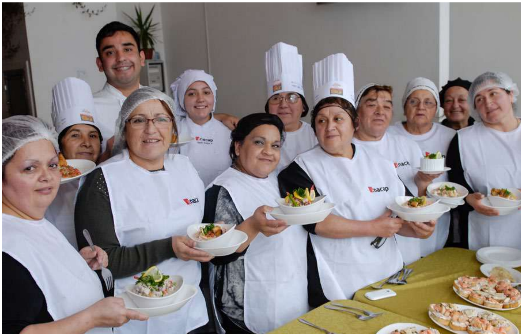
A mediados de mayo se dio inicio a las capacitaciones a los tres restaurantes que integran el piloto. Las jornadas que se desarrollarán durante mayo, junio y julio, consideran cursos intensivos de Protocolo y Atención y de Cocina Internacional, impartidos por docentes de Inacap.