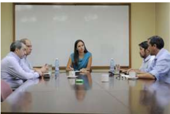
Recibió a dirigentes del Personal Embarcado.