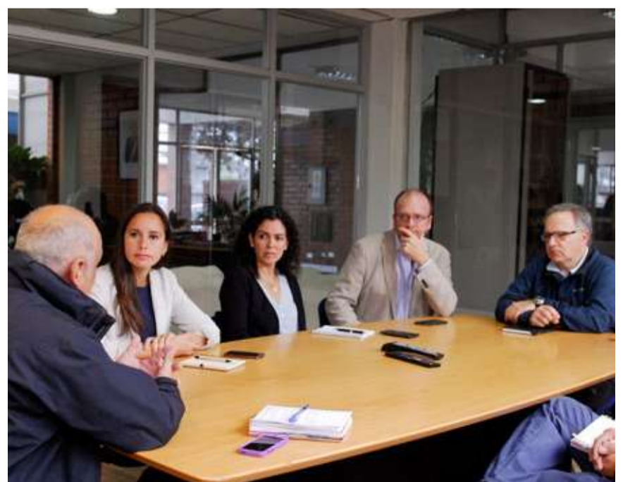
Ejecutivos de la industria pesquera solicitaron a la autoridad la fiscalización del total de la flota artesanal durante las 24 horas del día, además de comprometer una política de puertas abiertas de las descargas y plantas.

Los ejecutivos pesqueros también le expresaron a Sernapesca la voluntad por parte de las empresas de ASIPES de colaborar para que este fiscalizador pueda cumplir con su labor sobre el 100% de las naves que proveen de materia prima al sector industrial," de