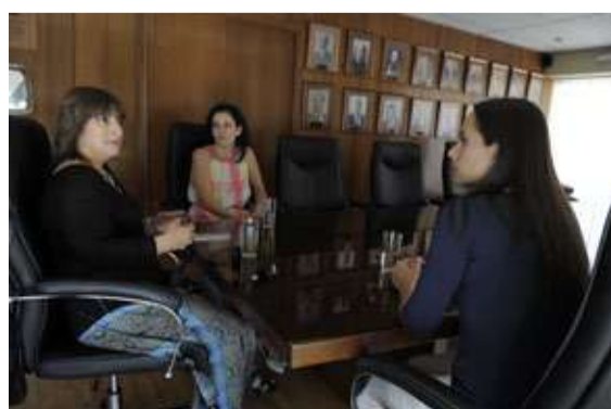
En la Cámara de la Producción y del Comercio de Concepción, junto a su presidenta.