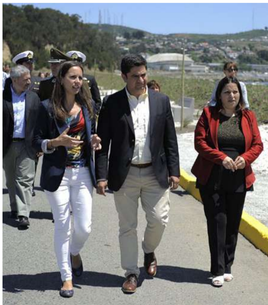
Este proyecto de recuperación ambiental representa una forma de contribución de la Pesca Industrial a las comunas donde opera, luego de completar un ciclo de inversiones relevantes en materia de olores, transporte de pesca, mitigación de material particulado, entre otros.