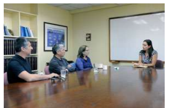
Con representantes de trabajadores de plantas de proceso, agrupados en Fesip.